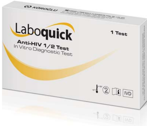
Laboquick Anti-HIV 1/2 Test / Laboquick Anti-HIV 1/2 Testi Package Content / İçerik: 1 Test Specimen / Numune: Urine / İdrar Package Dimensions / Ambalaj Ebatları: 132 x 70 x 20 mm Package Weight / Ambalaj Ağırlığı: 15 gr

Barcode No / Barkod No: 8699195610471 Product Code / Ürün Kodu: HAM.LBHU.01