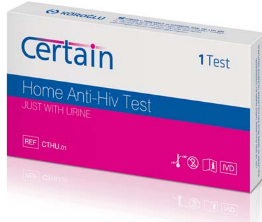
Certain Anti-HIV 1/2 Test / LCertain Anti-HIV 1/2 Testi Package Content / İçerik: 1 Test Specimen / Numune: Urine / İdrar Package Dimensions / Ambalaj Ebatları: 132 x 70 x 20 mm Package Weight / Ambalaj Ağırlığı: 15 gr

Outer Package Dimensions / Koli Ebatları: For 300 / 300 Ürün: 270 x 340 x 380 mm For 800 / 800 Ürün: 375 x 440 x 515 mm For 1400 / 1400 Ü. : 440 x 620 x 515 mm